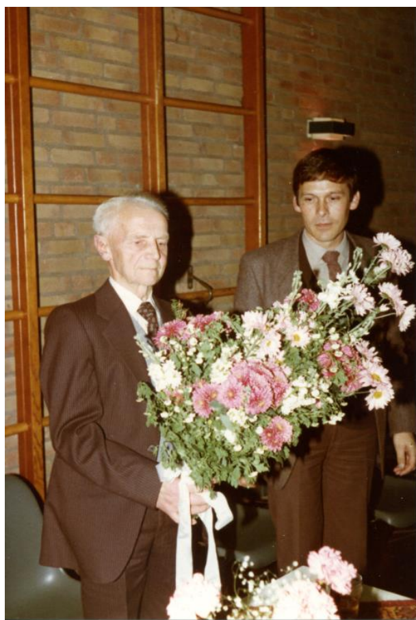
30 april 1962 zilveren eremedaille Orde van Oranje Nassau